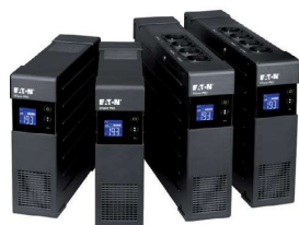
Серия Ellipse Pro

Источник бесперебойного питания 650/850/1200/1600 ВА