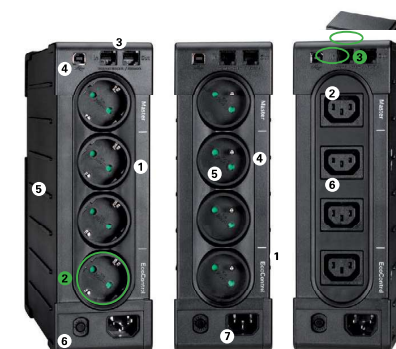
ИБП Eaton Ellipse PRO 650 ИБП Eaton Ellipse PRO 1600